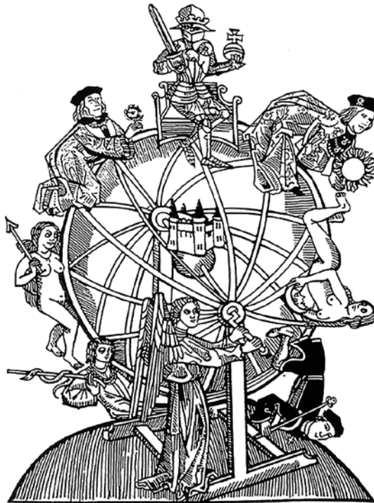
La Ruota della Fortuna

Le rappresentazioni medievali della Fortuna, ne sottolineano la dualità e l'instabilità, come per esempio due facce una accanto all'altra, una sorridente e l'altra accigliata, oppure una faccia bianca e una nera. La fortuna viene spesso rappresentata bendata, come casuale dispensatrice di abbondanza o eventi favorevoli. Le rappresentazioni iconografiche in auge fino al tardo medioevo, la vedono reggere tra le braccia la cornucopia, o reggere un timone, poiché pilotava la sorte degli esseri umani.