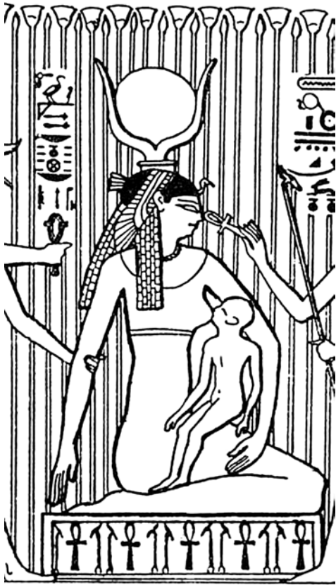
Iside che allatta Horus

senza alcun preconcetto, in completa libertà spirituale. Unendo scienza e saggezza nella sua anima, farà nascere in sé la vera religione e la vera devozione...».