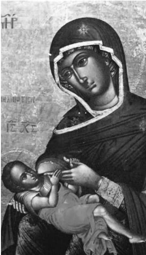
La vergine Maria