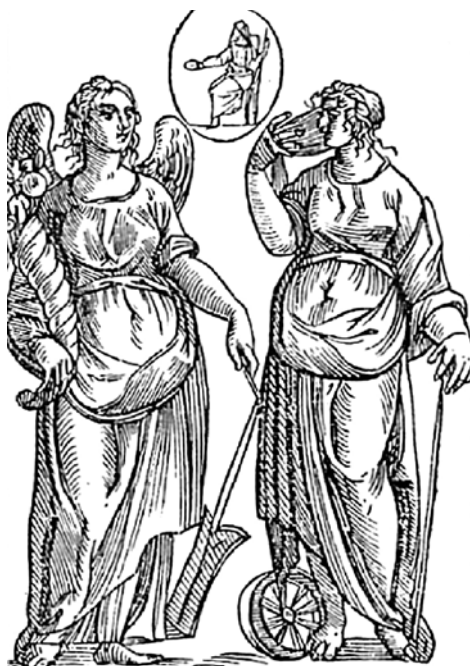
Fortuna e Nemesi