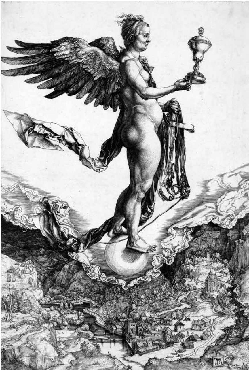
Fortuna in una incisione di Dürer