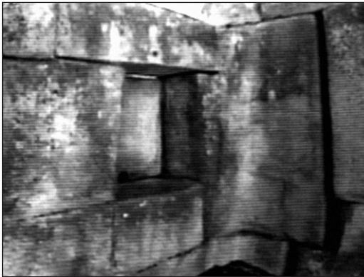
Fig. 1 - Nel “tempio delle Tre Finestre” di Machu Picchu (Perù) troviamo un’unica pietra angolare di notevoli dimensioni, che è stata scavata come fosse di burro. Un risultato che con le tecniche tradizionali può essere ottenuto solo a costo di un lunghissimo lavoro di incisione.

esistere. Stando infatti alla storia ufficiale, prima del 3000 a.C. non vi era alcuna civiltà evoluta e inoltre i popoli delle Americhe non sarebbero mai venuti in contatto con quelli dell’Africa e dell’Europa. Ciononostante, esistono ormai le prove evidenti che chi costruì le opere megalitiche ancora oggi avvolte nel mistero utilizzò le stesse tecniche di costruzione in tutti i diversi continenti del globo. Basta quindi osservare il metodo di lavorazione utilizzato per i blocchi di pietra ciclopici di opere come il tempio delle tre finestre di Machu Picchu (America Latina) e il tempio egizio dell’Osireion (Africa) per capire quanto queste costruzioni abbiano in comune tra loro.